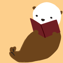
キャラクターデザイン：若杉郁子