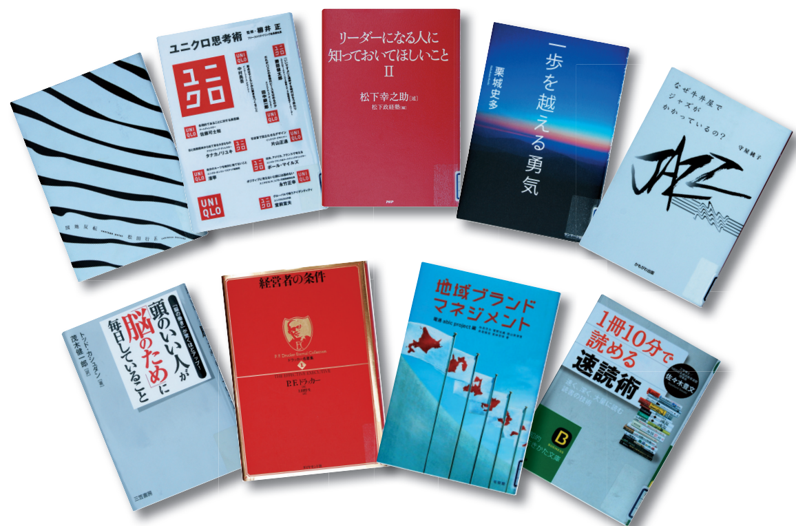
今年度リクエストで購入した本の一部です。

あなたが読んでみたい本、聴いてみたいCDなどが図書館に所蔵していない場合には、どしどしリクエストしてみてください。予算面などで購入できないこともありますが、できるだけ要望にお応えしたいと思っています。所定の用紙に記入してカウンターに提出するだけで、申し込みも簡単です。