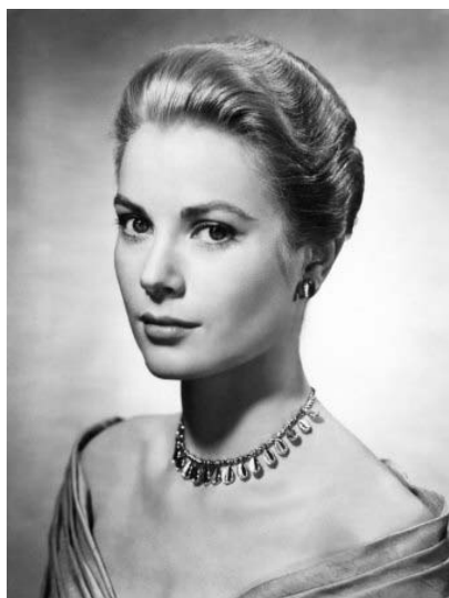
グレース・ケリー