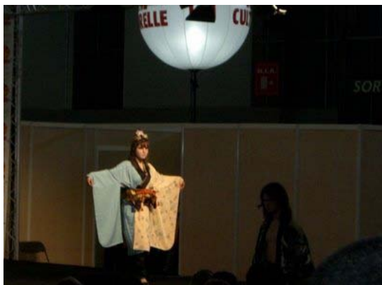
コスプレのレベルも高い・・・