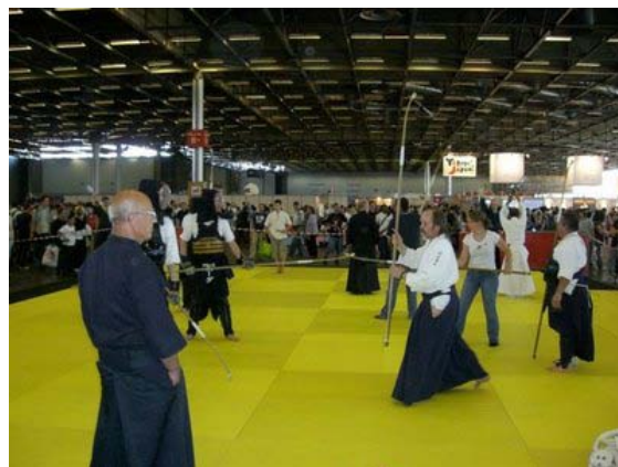
武術体験や着物ショーも行われました