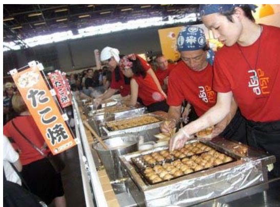
たこ焼きの店も出ていたようです