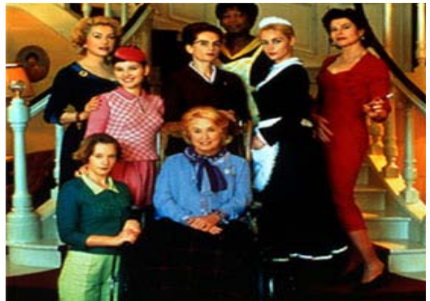
(↑上の写真の位置と同じ配置)

映画を観て感じたこと。。。( Chihiro ) ミュージカルのような映画でした！歌って踊る女性たちは、映画の中のどろどろした関係性を感じさせないおもしろさがありました。映画の最後で、「確かなものは何一つない、人間の強さも弱さも真心も、幸せな愛なんてない」と歌っていました。この映画はそういったことを伝えたいのだらうと思います。